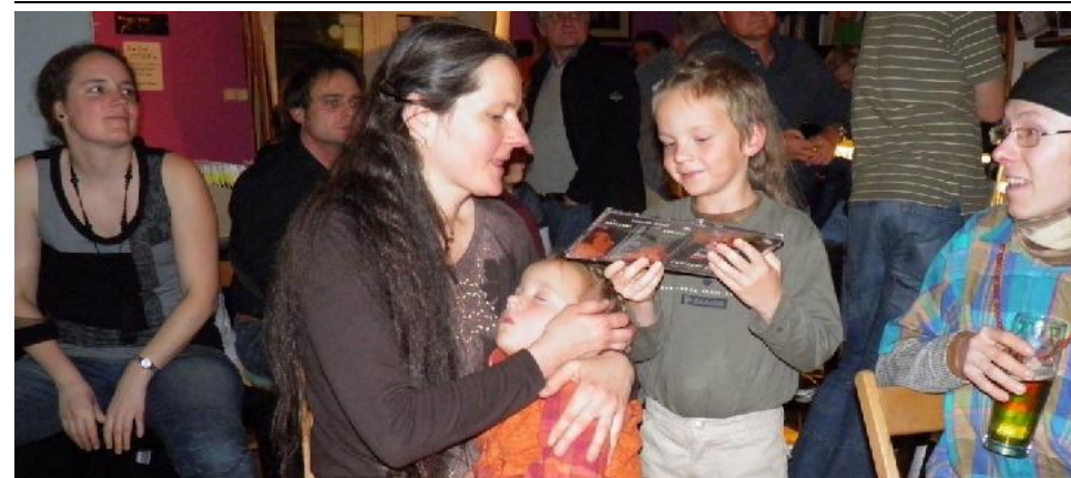
Momentka z publika... / Open Mic POTRVÁ #48 / 2. listopadu 2011